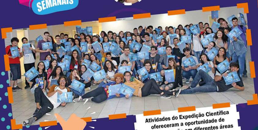
Atividades do Expedição Científica ofereceram a oportunidade de experimentação em diferentes áreas