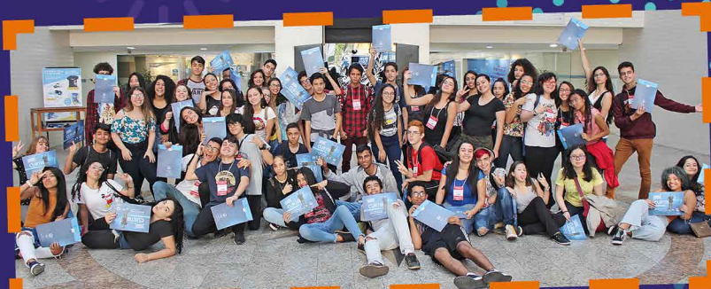
Estudantes vivenciaram a teoria na prática no Expresso Científica

Que venham novos desafios. A UNISANTOS está de portas abertas!