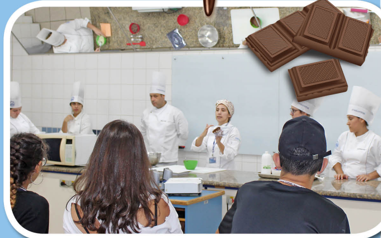
No Laboratório de Gastronomia e Nutrição, estudantes aprenderam receitas com chocolate