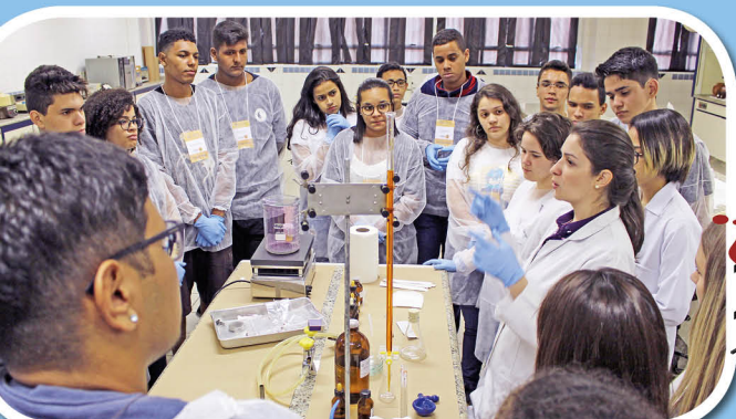
Estudantes viram como a química pode revelar informações ocultas de crimes