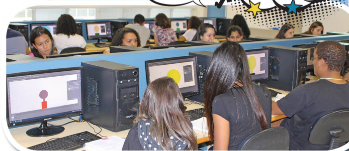
Softwares específicos foram utilizados para o desenvolvimento de desenhos animados