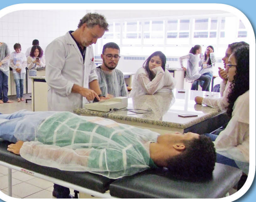
Na Oficina de Nutrição foram realizados exames