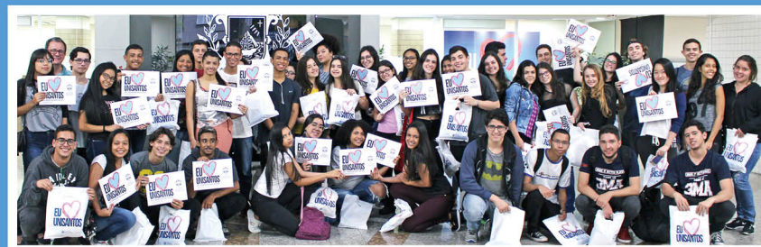
Estudantes exibem o certificado do Programa Expedição Científica, concluído em outubro do ano passado

Acesse os editais de cada programa no link www.unisantos.br/educacao-cientifica .