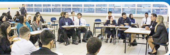
Simulado discutiu temas da atualidade

Eles discutiram a mudança da embaixada norte-americana para Jerusalém, o embargo de cargas vivas e o Acordo de Paris.