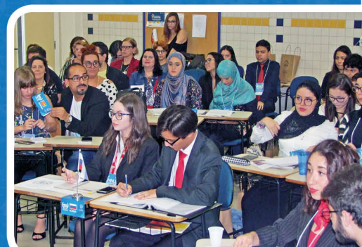
Estudantes representaram diferentes países