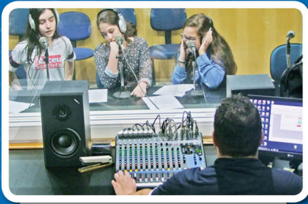
No estúdio, estudantes produziram e gravaram um miniprograma

Durante três meses, eles participaram de oficinas em diferentes áreas do conhecimento, realizaram experiências e utilizaram inúmeros recursos tecnológicos.