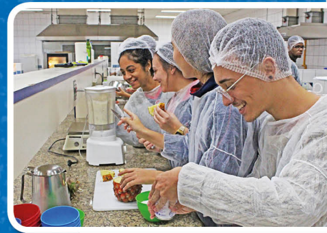
No Laboratório de Gastronomia, jovens produziram receitas