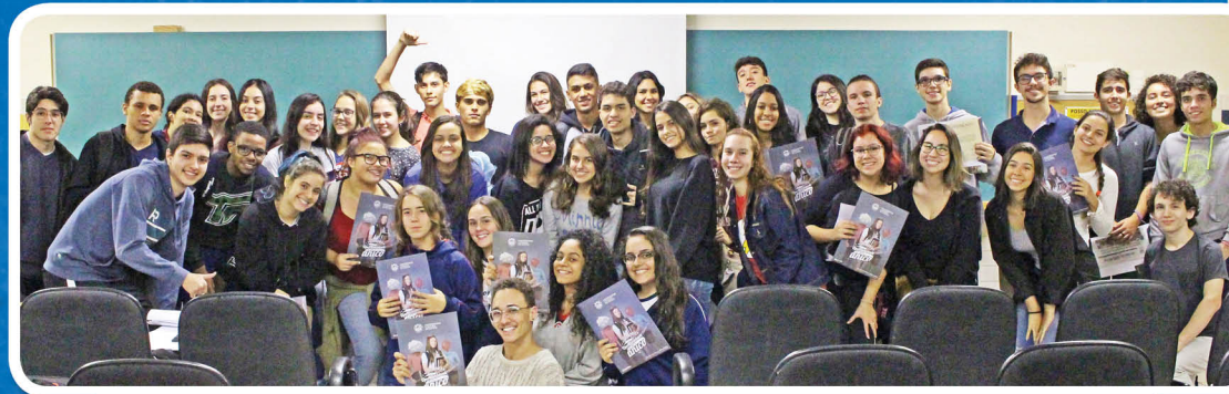
Estudantes que participaram do encerramento das atividades