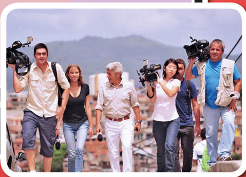
Caco Barcellos e a equipe do Profissão Repórter

O curso de Jornalismo da UniSantos foi o único da região selecionado pela Rede Globo de Televisão para participar do “Globo Lab: Profissão Repórter”, uma oficina que desafiou os estudantes a propor reportagens. Os autores das melhores irão vivenciar o dia-a-dia na redação do Profissão Repórter , ao lado do jornalista Caco Barcellos .