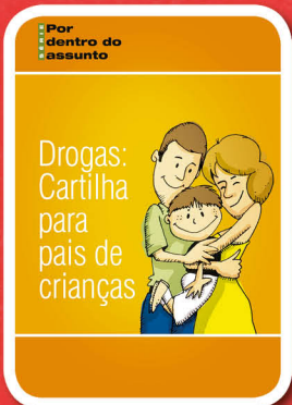
Cartilha elaborada pelo Ministério da Justiça