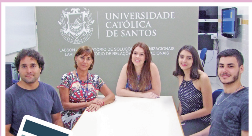
Equipe que desenvolve o projeto é formada por docentes e estudantes